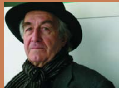
René Burri