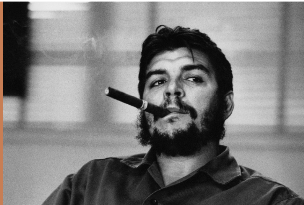
Che Guevara, Cuba, 1963

zijn definitieve lidmaatschap van Magnum.