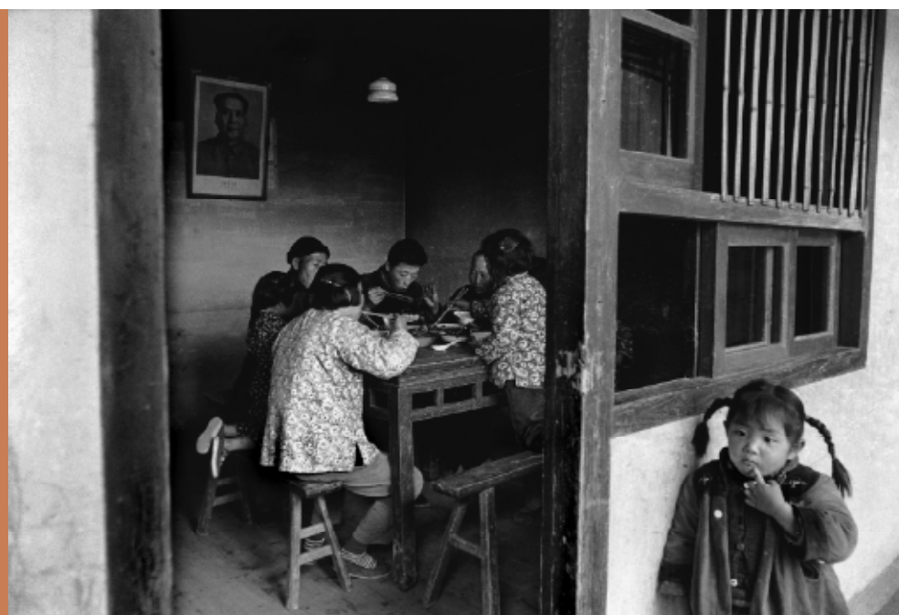
Ma Cheo People's Commune, near Shanghai, 1964

'Door de digitale fotografie heeft fotografie veel geloofwaardigheid verloren', beweert hij. 'Men vroeg mij laatst of ik bij een bepaalde oorlogsfoto de helicopters met Photoshop erin heb gemonteerd. Omdat ze er net als vogels uitzien, zo ongeloofwaardig esthetisch verantwoord in een hectische situatie. Nou, dat moment heb ik simpelweg vastgelegd. Ik vind dat je waarheidsgetrouw moet blijven. In dialogen en in fotografie. Het ethische aspect niet het oog verliezen en niet alles maar fotograferen. Schat een situatie in en kijk naar de betekenis erachter. Fotografie is een uiting van menselijke expressie. Het wordt nu, door de komst van de digitale fotografie, steeds meer conformistisch. Je kunt de hele wereld met knip- en plakwerk aan elkaar componeren. Prima, dat kan kunst zijn. Maar we hebben ook mensen nodig die erop uit trekken. Hardcore fotografen die de gebeurtenissen van vandaag verslaan. Breng de kinderen educatie bij. Om er over vijftig jaar de broodnodige conclusies aan te verbinden.'