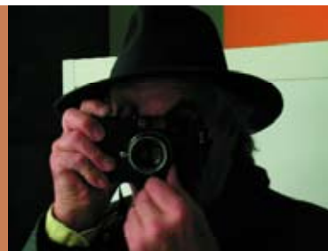
René Burri

Over de gemiste foto's in zijn loopbaan wil Burri ooit nog een boek schrijven. Zoals zijn verblijf in Israël tijdens de zesdaagse oorlog in 1967. 'Een surrealistische oorlog. Het was voor een foto-opdracht van Magnum, waarover later het boek en de expositie Tierre de Guerre verschenen, en ik filmde er eveneens. Ik kwam relatief laat aan. Op een gegeven moment bevond ik me al filmend in de Sinai'-woestijn, en voelde instinctief dat iets of iemand naar me keek. Ik draaide me om en stond aan de grond genageld. Achter me stak een