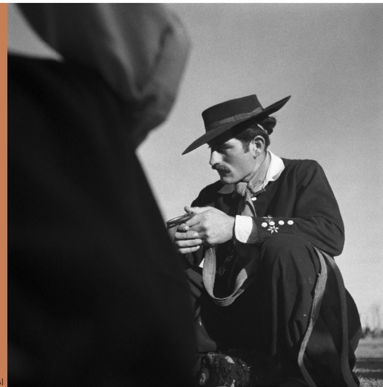
El Gaucho, The Pampas, 1958

zwarte, dode hand uit het zand. Ik kwam niet eens in de verleiding een foto te maken, ben walgend en huilend weggelopen. Later kreeg ik de wind van voren bij Magnum. Hoe ik het in mijn hoofd had gehaald om een internationaal coverbeeld te laten liggen! Maar er zijn grenzen, vind ik. Sommige dingen moet je niet fotograferen. Ook al zou je je lafheid willen maskeren door het toch te doen. Jaren eerder, in 1959, zag ik in een verlaten straat in New York Greta Garbo recht op me aflopen. De diva was verborgen achter een enorme zonnebril. Ik stond daar alleen maar gehypnotiseerd, en dacht niet aan klikken. De anti-papparazoreflex. Later heb ik me wel voor mijn hoofd geslagen. Het beeld staat nog altijd in mijn geheugen gegrift.'